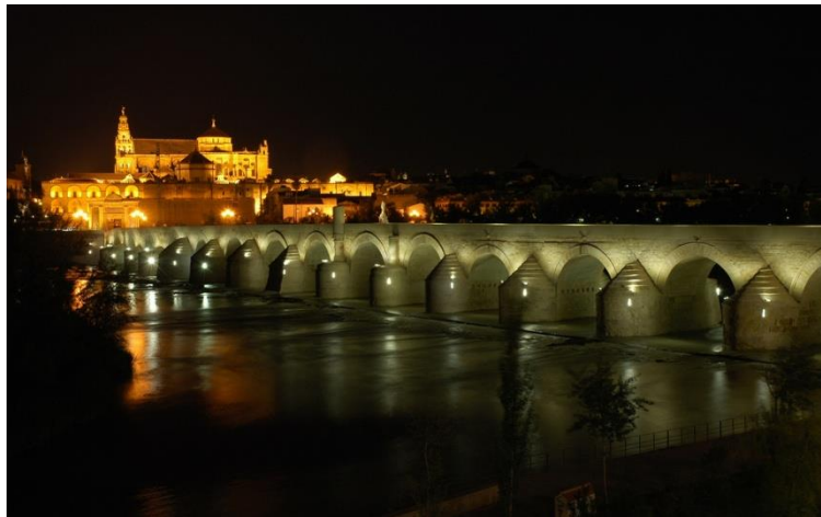
Figura 1: Puente Romano.

Con estas premisas, el papel de la AF es primordial, ya que el acercamiento a la ciudad a través de la misma, es algo que viene realizándose en Córdoba en bicicleta, sin embargo el desplazamiento a pie abarata los gastos y es menos peligroso para las edades a las que va dirigido este proyecto (escolares de los niveles de EI y EP). El conocimiento de la ciudad a pie permitirá disfrutar y valorar el turismo y el patrimonio que ésta ofrece acercando al alumnado al patrimonio cultural de la ciudad de una manera lúdica y saludable.