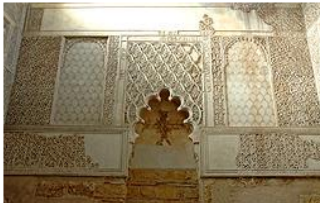
Figura 5: Sinagoga.