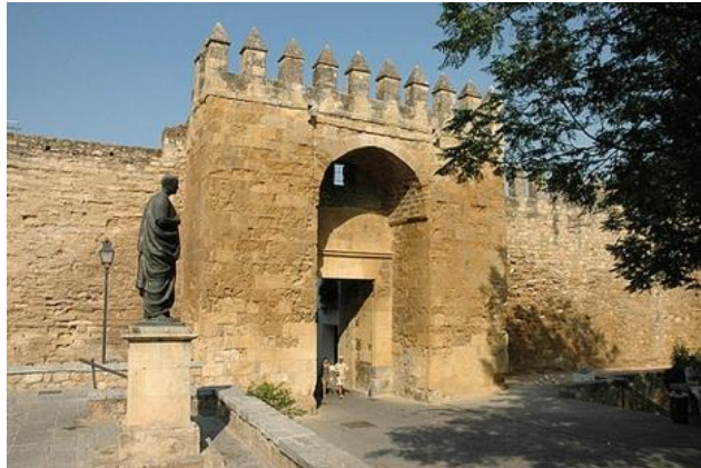
Figura 3: Puerta de Almodóvar.