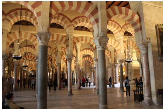
Figura 8: Mezquita de Córdoba.