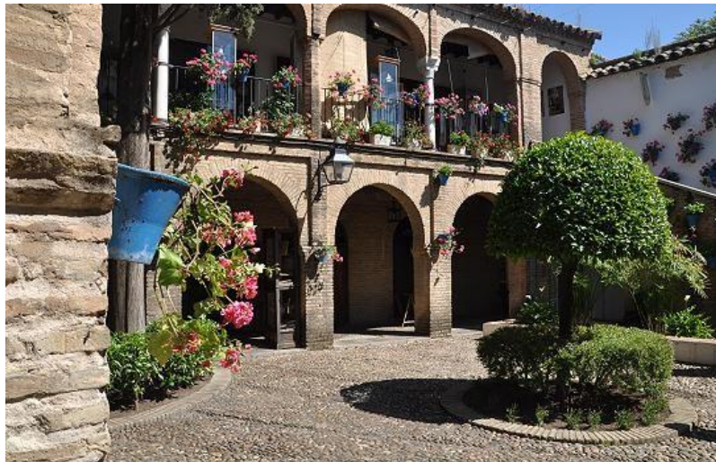
Figura 4: Zoco.