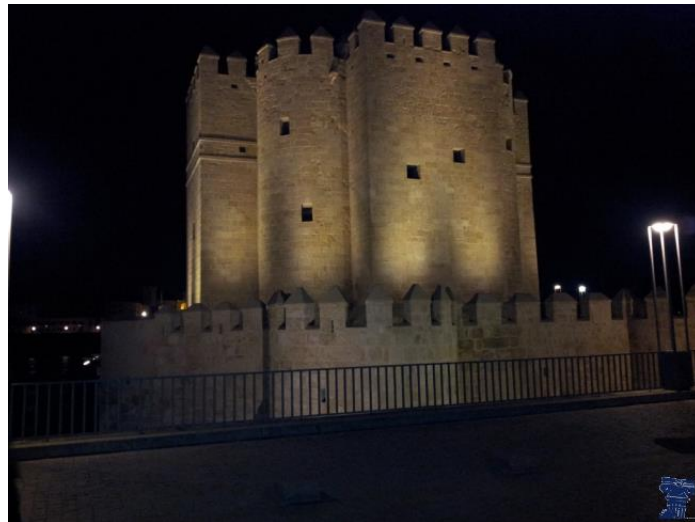
Figura 7: Torre de la Calahorra.