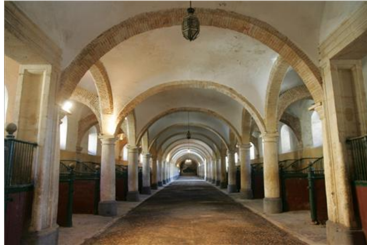
Figura 6: Caballerizas reales.